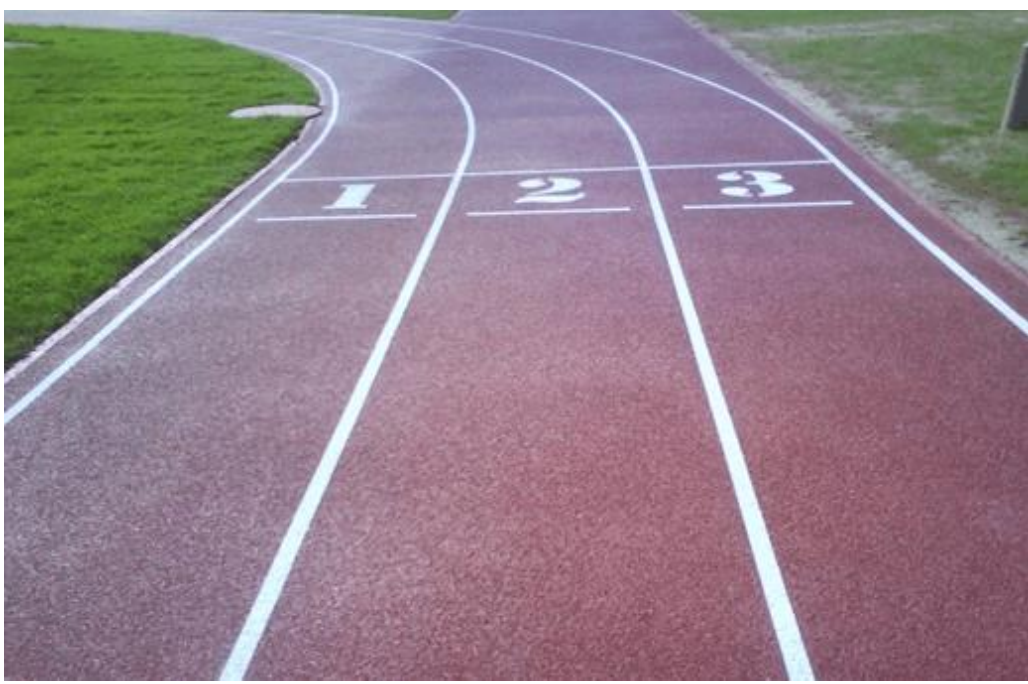
Arrangement of a playground for outdoor sports simulators