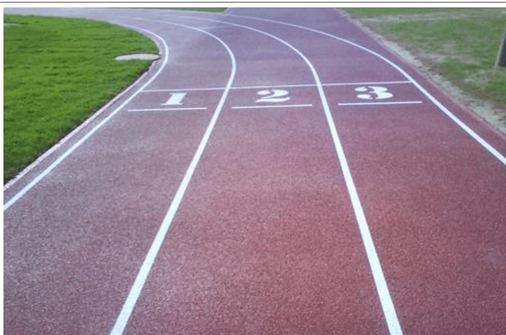
Обустройство площадки для уличных спортивных тренажеров